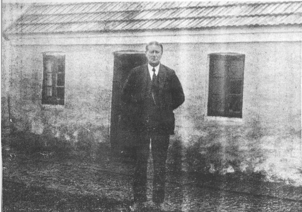
Den kloge mand fra Bratbjerg fotograferet udenfor gården. Foruden klog mand var han hestehandler