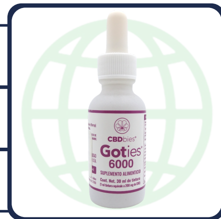
GOTERO DE 30 ML