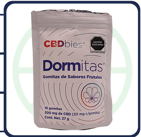
GOMITA PROMEDIO DE 2.17 GRAMOS

Análisis Solicitados: Medición de cannabinoides (MCR001) Método Interno Basado en "DAB 2018 Cannabisblüten" (U-HPLC)