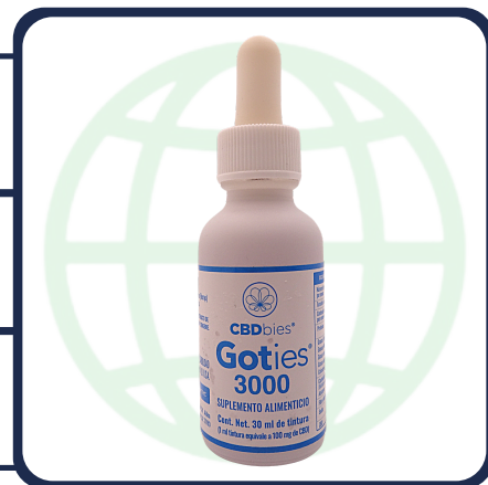
GOTERO DE 30 ML