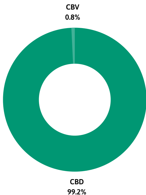
PERFIL DE CANNABINOIDES

Método Interno Basado en "DAB 2018 Cannabisblüten" (U-HPLC)