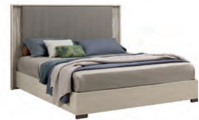
Q.S./UK 5" BED PJJ0150 (UK FIRE RETARDANT) PJJ0150I Inner size inch 61" x 80 3/4" - cm 155 x 205 inch W 67" D 85" H 55" cm L 168,9 P 214,7 H 140,3 Crts 2 kg 97 m 3 0,38

inch W 27" D 17" H 22" cm L 69 P 43,3 H 54,7 Crts 1 kg 30 m 3 0,18