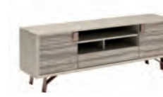
TV BASE KJJP630

inch W 44" D 1" H 41" cm L 111,8 P 2,6 H 103,9 Crts 1 kg 27 m 3 0,09