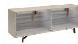
4/D BUFFET GLASS DOORS US LIGHT KIT PJJ0611 UK LIGHT KIT PJJ0612 EU LIGHT KIT PJJ0613 With 4 glass doors

inch W 82" D 20" H 31" cm L 208,7 P 51,3 H 79,5 Crts 1 kg 107 m 3 0,9