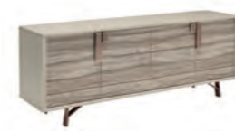
4/D BUFFET KJJP610 With 4 doors

inch W 82" D 20" H 31" cm L 208,7 P 51,3 H 79,5 Crts 1 kg 107 m 3 0,9