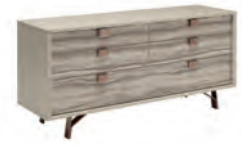
DRESSER KJJP120 With 6 drawers

inch W 68" D 20" H 32" cm L 173 P 51,3 H 80,2 Crts 1 kg 94 m 3 0,74