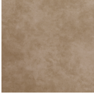
VBE | ヴィンテージ・ベージュ