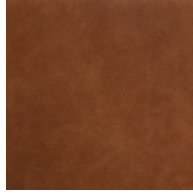
VCA | ヴィンテージ・キャメル