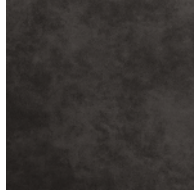
VBK | ヴィンテージ・ブラック