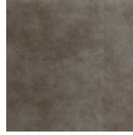
VKH | ヴィンテージ・カーキ