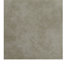
VGR | ヴィンテージ・グレー