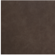
VDB | ヴィンテージ・ダークブラウン