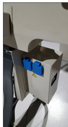
Box mit Frequenzumrichter und 2 Steckdosen

CE-conform durch Sicherheitsschalter Lackierung RAL 9002 und RAL 7016 Länge Bankbett 1.150 mm Gesamtlänge 1.450 mm Breite: ca. 600 mm Gewicht 110 kg Gewicht mit Füßen 180 kg