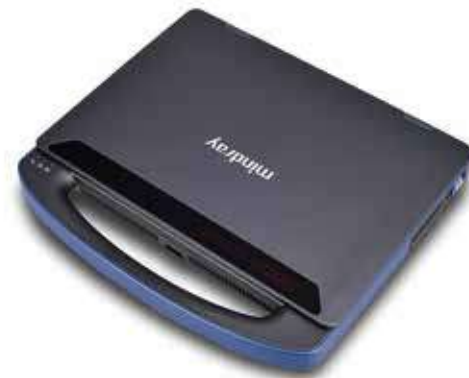
Visualice, ilumine y explore