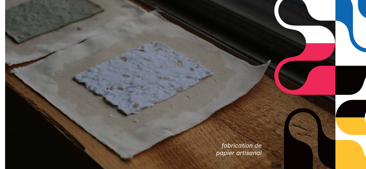
fabrication de papier artisanal

« J'ai pu compléter un sigle pour mes cours de français et cela m'a aidé dans mon parcours d'orientation scolaire et d'intégration du retour d'études » « Elle m'a aidé à comprendre des éléments de compétences tels que la persévérance et le travail d'équipe » « mise à jour de mes connaissances en mathématiques »