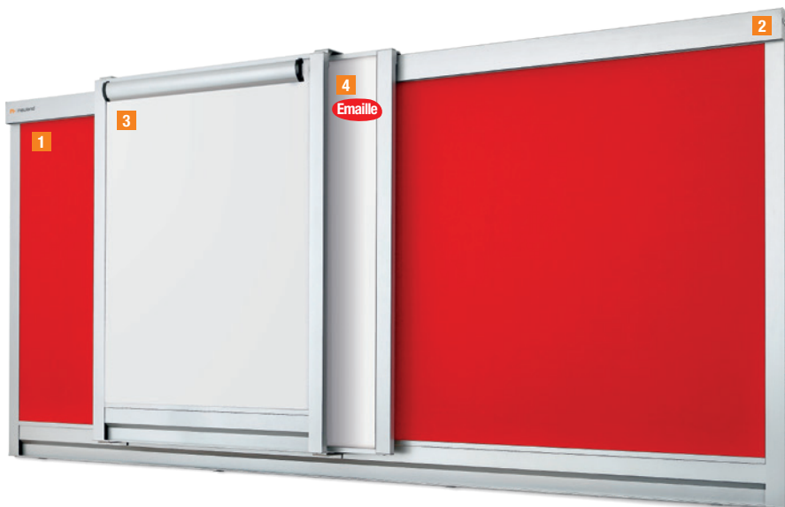
Abb.: LW-S Basiselement mit Zusatzschiene und verschiebbaren Tafeln in zwei Ebenen