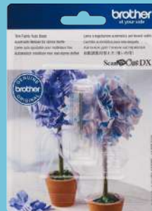
Cuchilla automática para tela delgada CADXBLDQ1