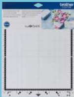
Tapete adhesivo estándar 12"x12" CADXMATSTD12