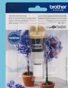
Sujetador de cuchilla automática para tela delgada CADXHLQ1