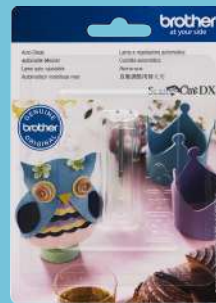
Cuchilla automática CADXBLD1