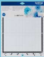
Tapete de baja adhesión 12"x12" CADMATLOW12