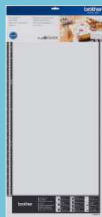
Tapete para Escaneo de 12"x24" CADXMATSTD24