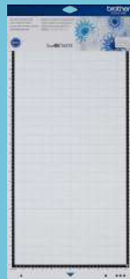
Tapete de baja adhesión 12"x24" CADXMATLOW24