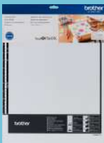
Tapete para escaneo de 12"x12" CADXMATSTD12