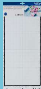
Tapete adhesivo estándar 12"x24" CADXMATSTD24