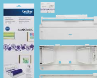
Alimentador de rollo CADXRF1