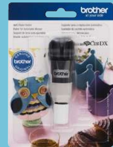
Sujetador de cuchilla automática CADXBLD1