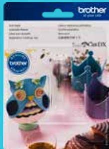
Cuchilla automática CADXBLD1