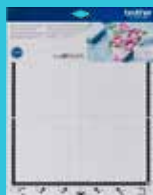
Tapete adhesivo estándar 12"x12" CADXMATSTD12