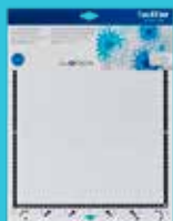
Tapete de baja adhesión 12"x12" CADMATLOW12