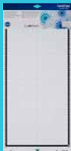
Tapete de baja adhesión 12"x24" CADXMATLOW24