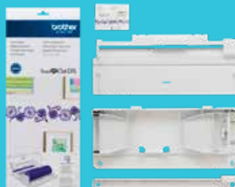
Alimentador de rollo CADXRF1