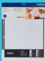
Tapete para escaneo de 12"x12" CADXMATSTD12