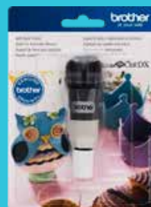
Sujetador de cuchilla automática CADXBLD1