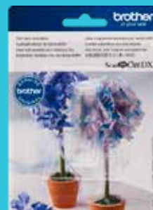
Cuchilla automática para tela delgada CADXBLDQ1