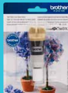
Sujetador de cuchilla automática para tela delgada CADXHLDQ1