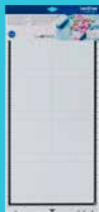
Tapete adhesivo estándar 12"x24" CADXMATSTD24