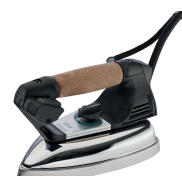
Dotazione ferro da stiro mod. EOS (fornito standard) Supplied with EOS iron (standard equipment)