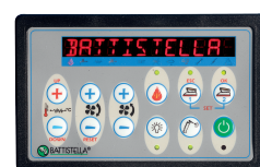
Console comandi Control panel