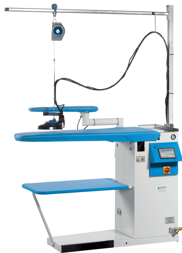
Piano di serie Standard board