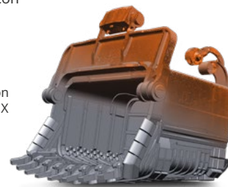
Modello solido parametrico creato con Geomagic Design X

Se si può fare con un CAD tradizionale, allora si può iniziare a utilizzare subito Geomagic Design X. L'interfaccia è completamente rinnovata e nuovi strumenti rendono più facile che mai creare rapidamente e con precisione modelli CAD 3D.