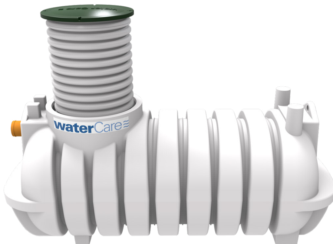
Eksempel på WaterCare 1.200 L samletank - Varenr.: 223193174