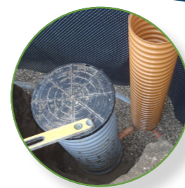
ATZ A/S installerar 2017-20 70 st. Ø425 mm dräneringspumpstationer i bostadsföreningen AST i Brønshøj utanför Köpenhamn.