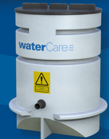
Liten pumpstation för t ex byggarbetsplatser VN: 223190607SK/609