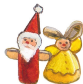
dekorácia na stôl