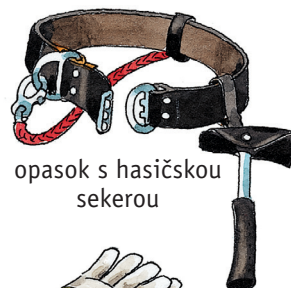
opasok s hasičskou sekerou