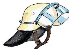
prilba s ochranou tváre a krku

Toto je ujo Tomáš. Už ako malý chlapec chcel byť hasičom a teraz pracuje ako profesionálny hasič. Pri každom zásahu musí mať na sebe ochranný odev. Vieš, čo ešte patrí k jeho výstroju?