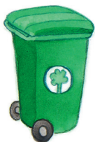
nádoza na smeti