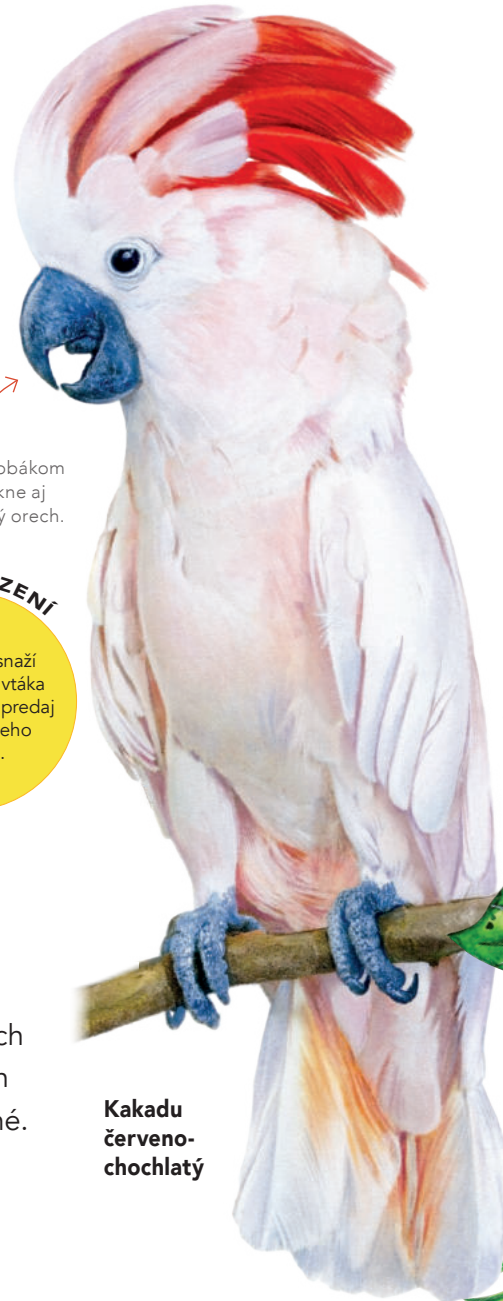
Kakadu červeno- chochatý

Veľa ľudí sa snaží chrániť tohto vtáka a zastaviť jeho predaj ako domáceho miláčika.