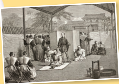
Seppuku sa vykonávalo pred divákmi.