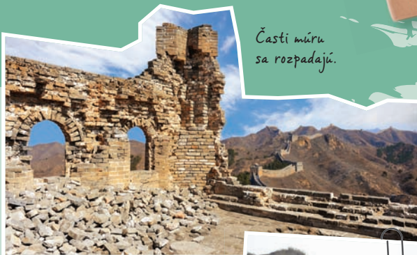
Časti múru sa rozpadajú.

Na vzhľade múru sa podpísalo veľa storočí. Poškodili ho živelné pohromy, ako sú silné búrky či zemetrasenia. Farmári odnášali kamene, aby z nich stavali domy a stajne. Za rozpad múru sú zodpovední aj turisti, ktorí si jeho časti berú domov ako suveníry.