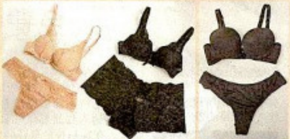
■ Emily參考身邊好友需要和喜好而設計內衣，故其內衣系列以女性友人名稱命名，備28至38A、28至36B及28至34C罩杯尺碼，款式多樣。(Bra/$470至$520、Bottom/各$240)