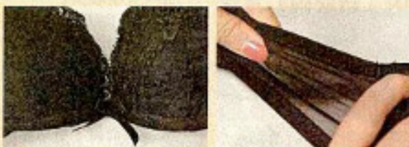
■ V位較窄可令胸部自然 Push Up。 ■ 闊身彈性橫帶有助胸部脂肪集中。

品牌取名「Little」絕對實至名歸，皆因其胸圍款式的最小尺碼是28A罩杯，比市面一般最小的32A罩杯更小，當中不乏喱士、暗花、T-shirt Bra等俏麗款式，小巧瘦削的女生不難沒選擇。內衣設計強化承托功能，收窄胸前V位距離，腋下橫帶改用彈性較強的布幅，採用貼身剪裁，穿著舒適同時集中胸部脂肪，營造迷人自然的胸形線條，展現本身的天賦身材，增強嬌媚及自信。