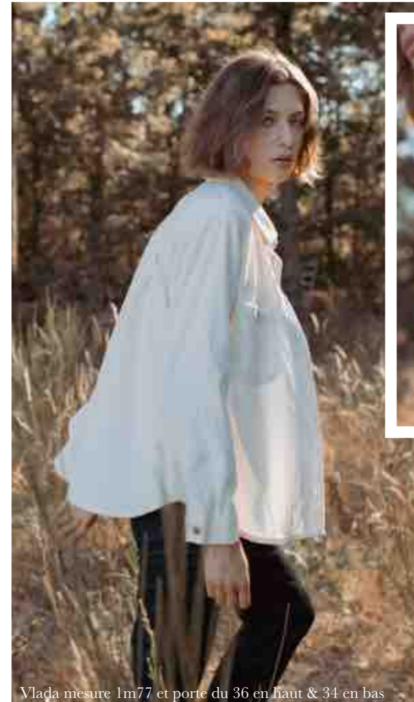
Vlada mesure 1m77 et porte du 36 en haut & 34 en bas

On craque pour ce pantalon en velours côtelé à la coupe cigarette qui met notre silhouette en valeur grâce à ses côtes fines ! En écru ou en gris ardoise, il nous va comme un gant !