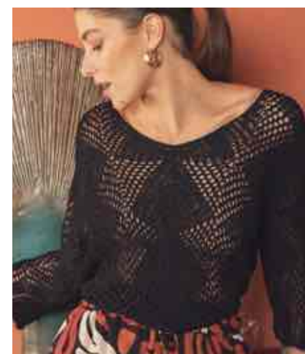
Pull ajouré 80124/900 - 79 € - T0 à T4