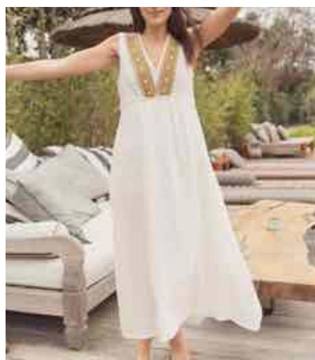
Robe longue coquillage 80131/001 - 119 € - 34 au 48