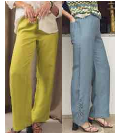
Pantalon détail macramé 70108/628 & 704 - 89 € - 34 au 52