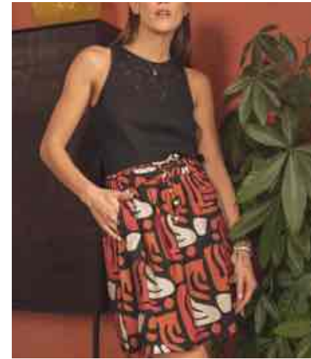
Jupe fluide 80134/213 - 59 € - T0 à T5