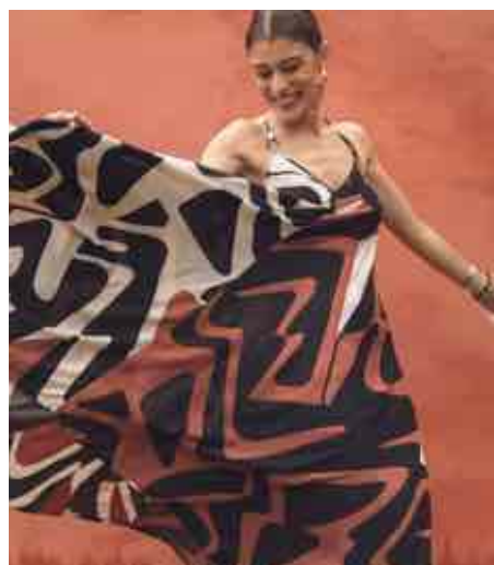
Robe foulard anneaux 80135/213 - 109 € - T0 à T4