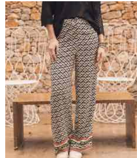
Pantalon fluide 80128/003 - 95 € - 34 à 48