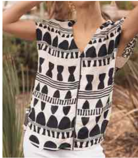
Blouse imprimés ethniques 80132/010 - 69 € - 34 à 52