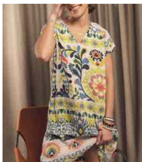
Robe courte imprimée 70110/002 - 95 € - 34 au 52