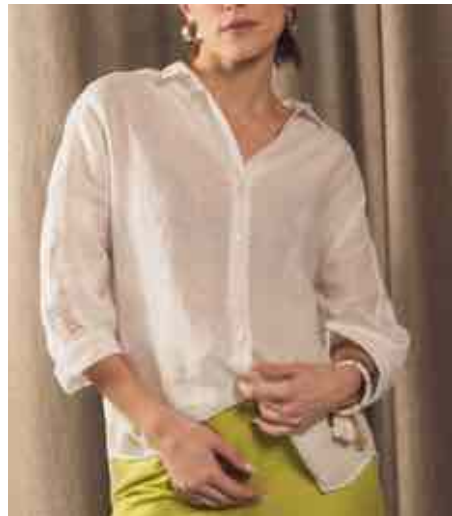
Chemise manches macramé 70107/001 - 89 € - T0 à T5