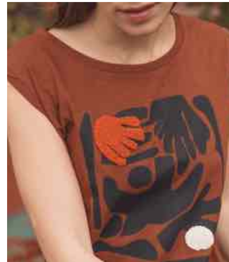
T-shirt motif placé 80133/213 - 49 € - T0 à T5