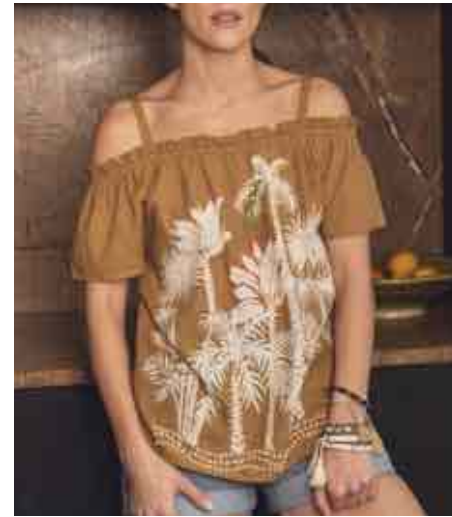
Blouse palmiers et broderie 80126/824 - 69 € - T0 à T5