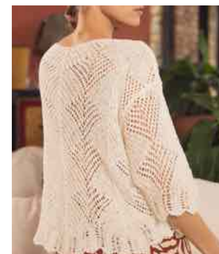
Pull ajouré 80124/002 - 79 € - T0 à T4