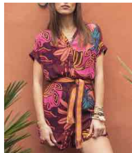
Combishort imprimée 80129/319 - 85 € - T0 à T4