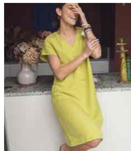
Robe courte macramé 70110/704 - 95 € - 34 au 52