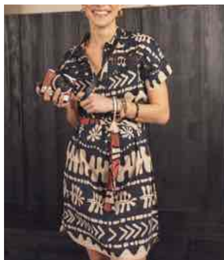
Robe imprimé arbre de vie 80136/900 - 95 € - 34 à 52