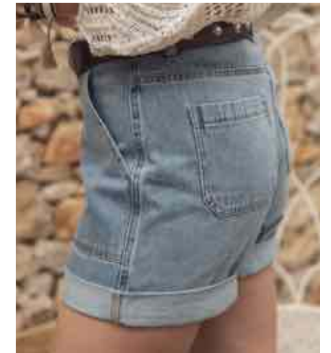
Short en jean 80127/631 - 65 € - 32 à 48