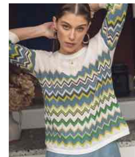
Pull rayures fantaisies 70105/010 - 85 € - T0 à T5