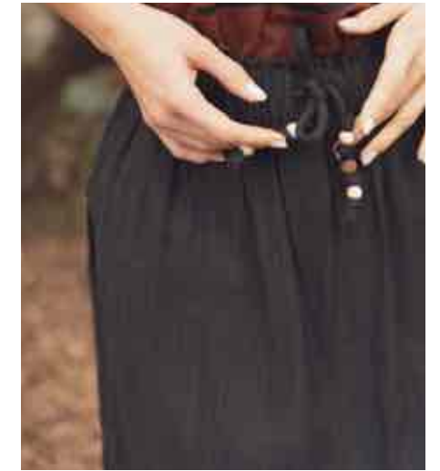
Jupe fluide 80134/901 - 59 € - T0 à T5