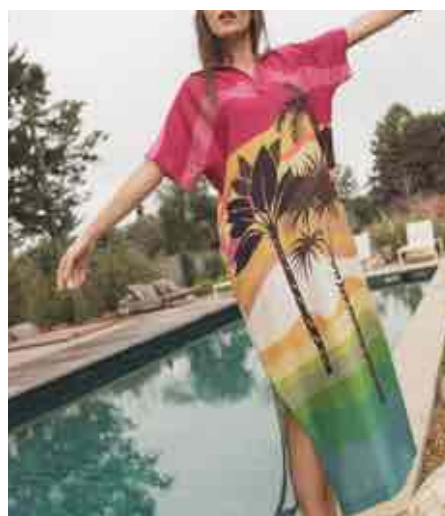
Robe palmiers et vague 80130/010 - 119 € - T0 à T4