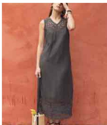
Robe midi macramé 70109/907 - 129 € - 34 au 48