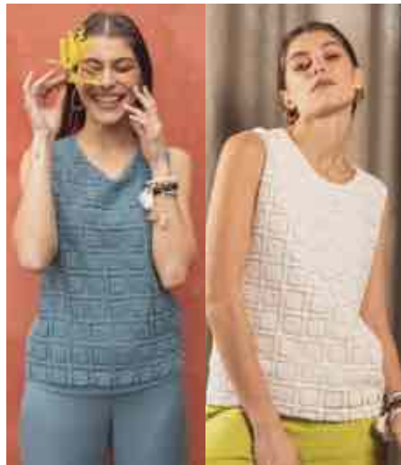
Top macramé 70106/001 & 628 - 59 € - T0 à T5