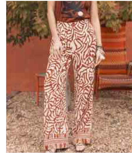
Pantalon fluide 80128/213 - 95 € - 34 à 48