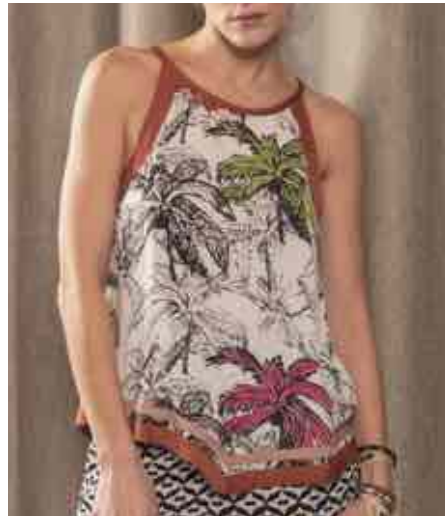
Top foulard 80125/003 - 65 € - 34 au 46