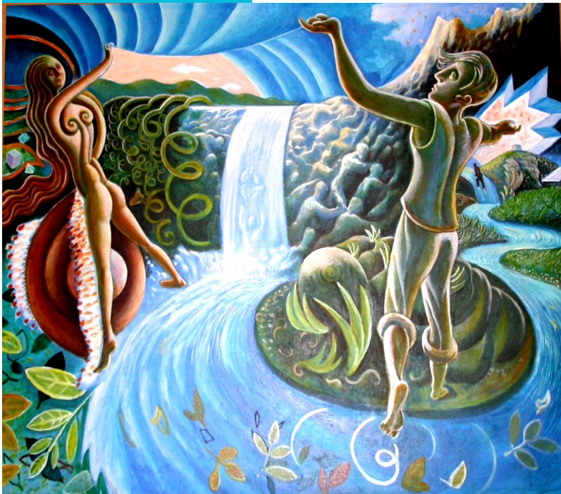
Fontana della Giovinezza

... prepara il corpo, e con esso lo spirito al RISVEGLIO DELLA PRIMAVERA.