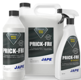
1 liter 5 liter 0,5 liter

1 flaska Grön-Fri Direkt räcker till ca 2,5 m 2 (spädes ej)