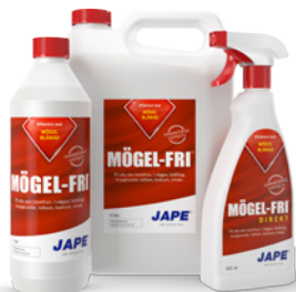
1 liter 5 liter 0,5 liter

1 liter Prick-Fri utspädd till 5 liter brukslösning räcker till ca 25 m 2 .