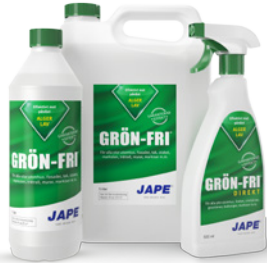
1 liter 5 liter 0,5 liter

En serie effektiva desinfektions- och rengöringsmedel från Jape. Väljer du dessa produkter får du ett heltäckande system för underhåll av fasader och andra ytor. Samtliga produkter är biologiskt nerbrytbara.