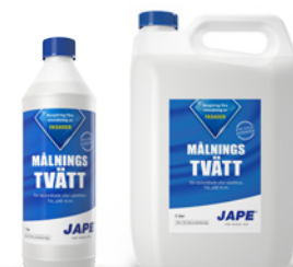
1 liter 5 liter

1 del Underhållstvätt spädes med 20 delar vatten. 1 liter brukslösning räcker upp till 15 m 2 .