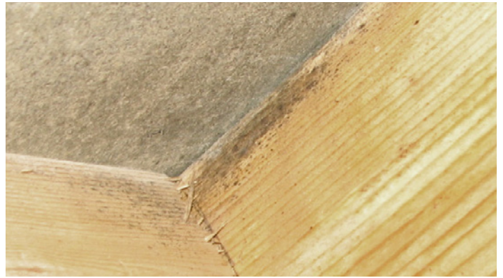
Takstol med mögelangrepp.