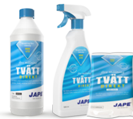
1 liter 0,5 liter Tvättduk

1 del Målningstvätt spädes med 20 delar vatten. 1 liter brukslösning räcker upp till 15 m 2 .