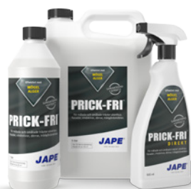
1 liter 5 liter 0,5 liter

1 flaska Grön-Fri Direkt räcker till ca 2,5 m 2 (spädes ej)