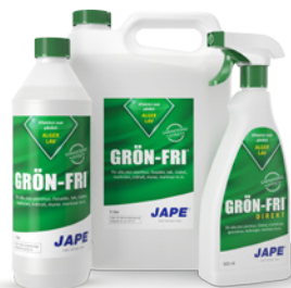
1 liter 5 liter 0,5 liter

En serie effektiva desinfektions- och rengöringsmedel från Jape. Väljer du dessa produkter får du ett heltäckande system för underhåll av fasader och andra ytor. Samtliga produkter är biologiskt nedbrytbara.