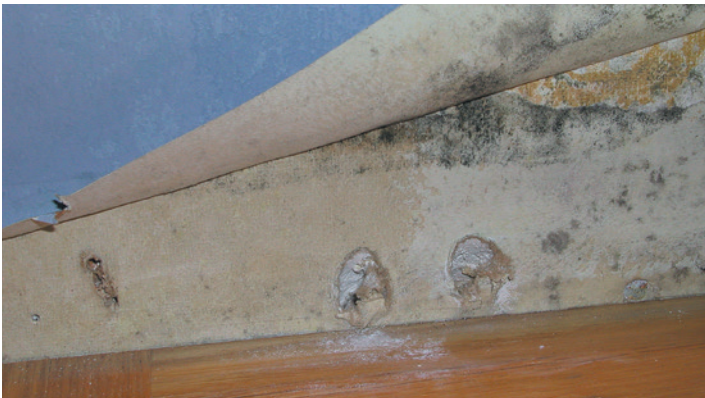
Mögelangrepp på gipsskiva under tapet.