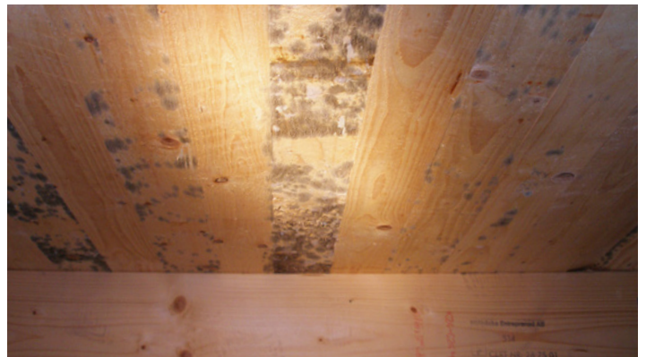
Krypgrund med kraftig påväxt av mögel.