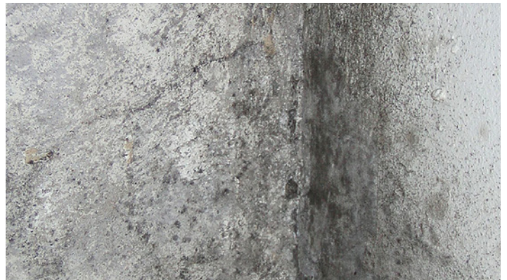
Putsad vägg i källare, svart av påväxt.