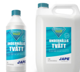
1 liter 5 liter

1 liter Prick-Fri utspädd till 5 liter brukslösning räcker till ca 25 m 2 .