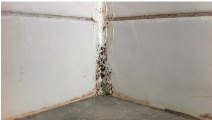
Mögel i kakelfog och silikonfog.