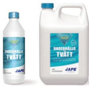
1 liter 5 liter

1 liter Møgel-Fri brukslösning (spädes ej) räcker till ca 5 m 2 .