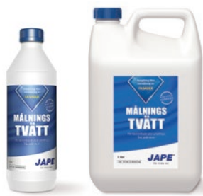
1 liter 5 liter

1 del Underhållstvätt spädes med 20 delar vatten. 1 liter brukslösning räcker upp till 15 m 2 .