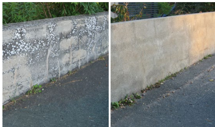
Putsad mur med angrepp av lav behandlad med Grön-Fri. Inget efterarbete. Vänster: Innan behandling. Höger: 4 år efter behandling.