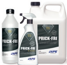
1 liter 5 liter

En serie effektiva desinfektions- och rengöringsmedel från Jape. Väljer du dessa produkter får du ett heltäckande system för underhåll av fasader och andra ytor. Samtliga produkter är biologiskt nerbrytbara.