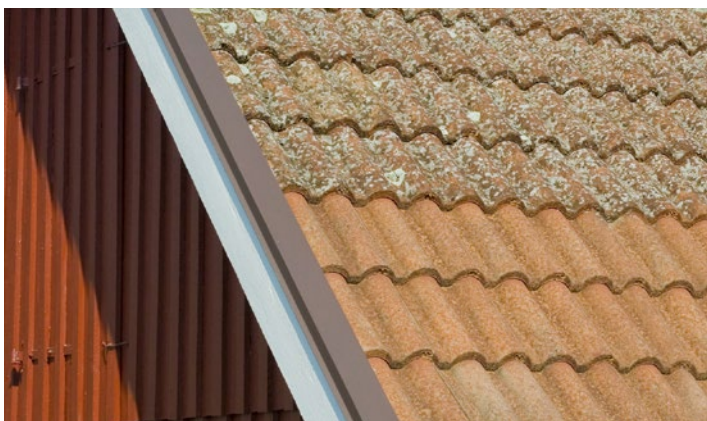
Tak av betongpannor med angrepp av lav. Två år efter behandling av Grön-Fri. Inget efterarbete.