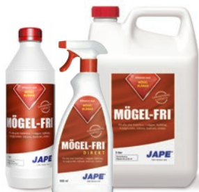
1 liter 0,5 liter 5 liter

1 liter Prick-Fri utspädd till 5 liter brukslösning räcker till ca 25 m 2 .