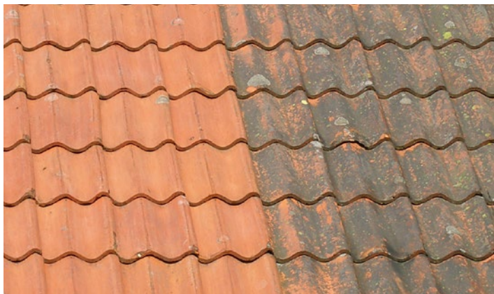
Tak av tegelpannor med angrepp av alger och lav. 2 år efter behandling av Grön-Fri. Inget efterarbete.