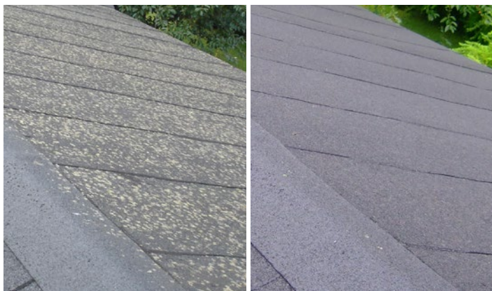
Tak av papp med angrepp av lav. 3 år efter behandling av Grön-Fri. Inget efterarbete.