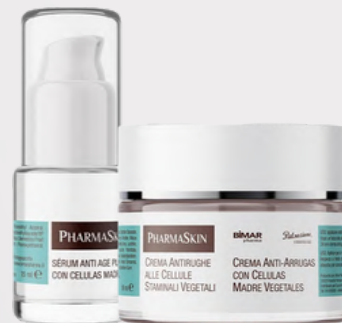
SIERO 15 ML

Trattamento 24 ore a base di Malus Domestica (varietà Uttwiler Spatlauber) svizzera presente in massima concentrazione. Altri principi attivi, quali il COENZIMA Q-10 e l'ALGA TYHALASSINA la rendono unica poiché contribuiscono a ridurre i danni ossidativi sulla cute provocati dalle radiazioni solari, dallo smog e dall'aria.