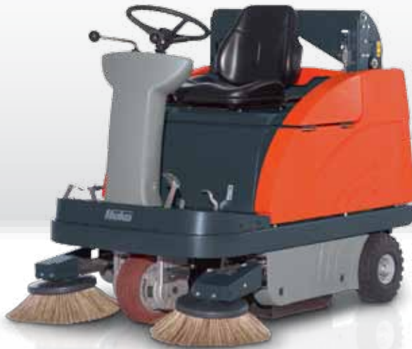
Sweepmaster B980 RH