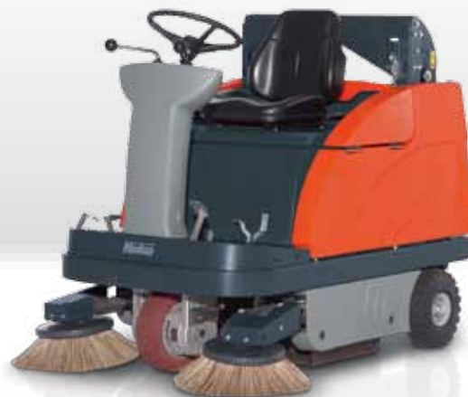
Sweepmaster B980 RH