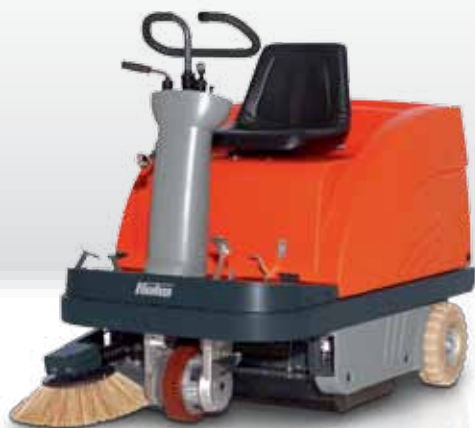
Sweepmaster B900 R