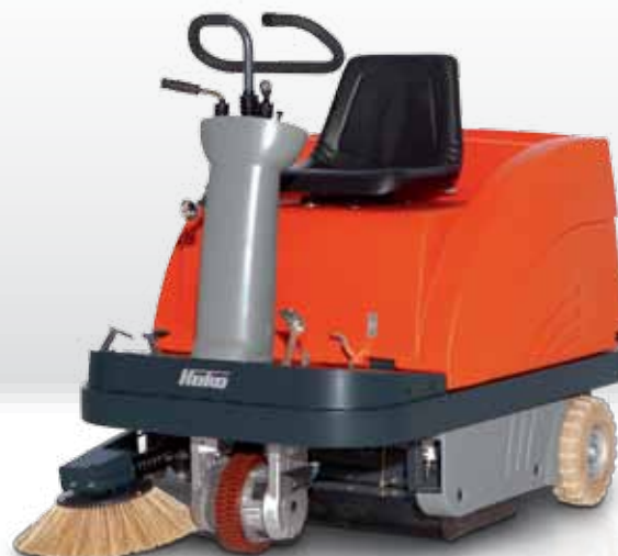
Sweepmaster B900 R