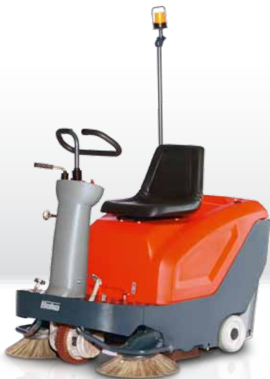
Sweepmaster B800 R