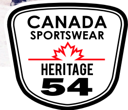
Écusson Heritage 54 sur la poche de la manche gauche