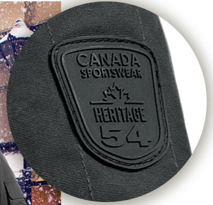
Heritage 54 Patch on left sleeve pocket