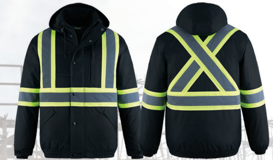
Outer Jacket / Blouson Extérieur