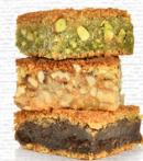
MIX MAAMOUL MAD

Blat din gris caramelizat, ușor însiropat, umplut cu pastă de curmale, aromat cu flori de portocal, trandafiri. Alergeni: 1, 8