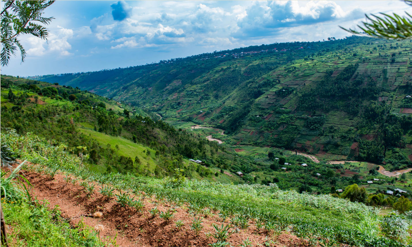
Junge Kaffeepflanzen der Kooperative Cocomu nahe des Kiwusee in Ruanda.

KLEEBERGER IST DEINE EINTRITTSKARTE IN DIE WELT DER SPEZIALITÄTENKAFFEEES.