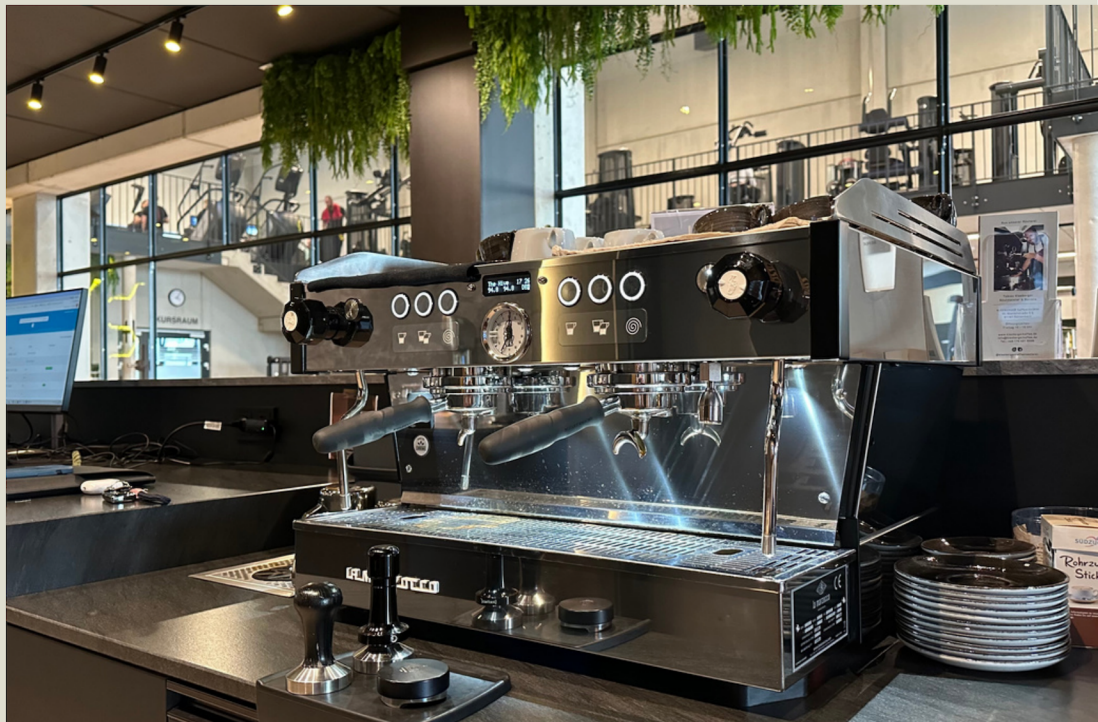
The HIVE Fitness - das modernste Studio Bayerns.