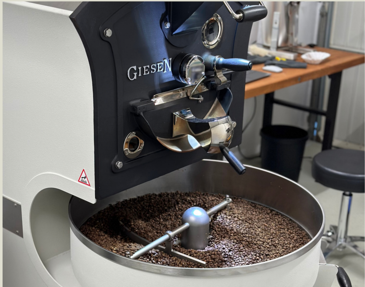
Unser Trommelröster Giesen W6 in Röttenbach.