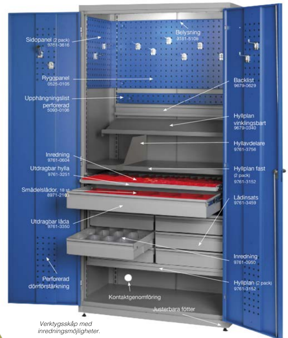
Verktygsskåp med inredningsmöjligheter.