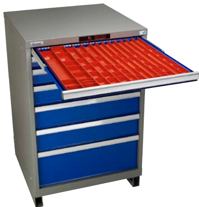
Hurts med inredningsmöjligheter.

Det finns olika hjälpmedel för att skapa närhet till rätt saker, samt smarta förvaringsplatser för de saker som används mindre ofta. Man kan exempelvis använda ledbara armar för att komma åt det som ska användas ofta och hyllplan, verktygspaneler eller bordshurtsar för att komma åt det som används mindre ofta. En genomtänkt förvaring är det bästa sättet för att skapa effektivitet i arbetet.