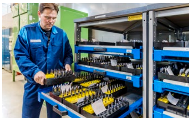
GKN:s skär för att finjustera olika kugghjul är inte bara extremt vassa utan även oerhört dyrbara. Självklart ska de förvaras tryggt och säkert i industribråer från Gigant!