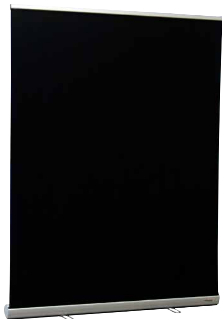
Mobil roll-up är en enkel och smidig lösning som passar för reparatörer, servicetekniker och andra som behöver en tillfällig och säker arbetsplats.