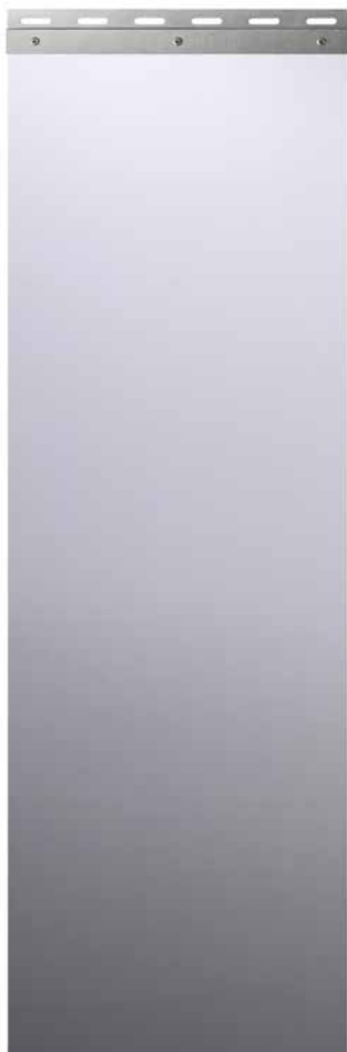
Stripesridåer minskar värmeutsläpp och skapar ett effektivare trafikflöde.