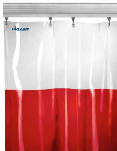
Draperier anpassas enkelt utefter behov. De avskärmar och ökar möjligheten för integritet, koncentration, struktur och skyddar effektivt mot exempelvis smuts, stänk, drag, gnistor och skadligt ljus.