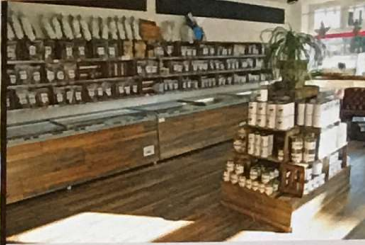
Barf-Produkte Auf Wachstumskurs