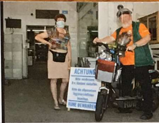
Zoo Zajac Gut durch die Krise