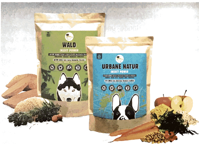
Für erwachsene Hunde: „Urbane Natur“ mit Proteinen der Mehlwürmer, „Wald“ die der Larven der Schwarze Soldatenfliege.

Sie wollen etwas bewirken: „Indem wir Fleisch in Hundefutter durch nachhaltiges Insektenprotein ersetzen, wollen wir den CO 2 -Fußabdruck der Heimtierfutterindustrie senken. Je mehr Hunde unsere Produkte fressen, desto größer ist unser Einfluss.“ Sie wollen es Hunden und ihren Besitzern ermöglichen, einen gesunden und ökologisch verantwortlichen Lebensstil zu führen: „Wir bauen Beutel für Beutel an einer gesünderen Welt.“ ■