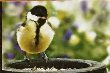
Heimische Wildtiere Rosige Zukunftsaussichten