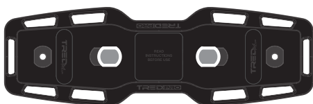
TRED 800 TRED 800