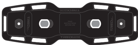
TRED PRO & TRED 1100 TRED PRO & TRED 1100