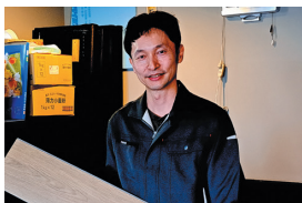
飲食店開業でDIY (北区)