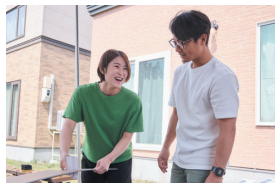
夫婦で新居をDIY (中央区)