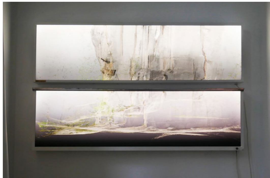
Daniel Bourgaïs, Bovan - Lune n°7_b, 2022 Photogrammétries, Impression UV sur Diffusant double encrage 3 mm Négatoscope 153 x 100 cm