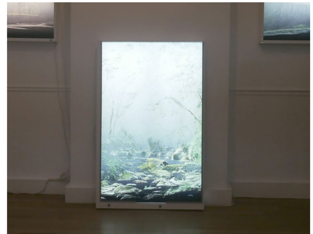
Daniel Bourgeois, Bovan - Lune n°7_c Photogrammétries, Impression UV sur Diffusant double encrage 3 mm Négatoscope 152 x 98 cm - 2022

Face à la disparition de celles-ci, les habitants se mobilisent pour sauvegarder la dernière en plantant des bambous pour la masquer, créant des zones sombres, une éclipse, le «laho». C'est le regard porté sur son environnement, sa fragilité qui a guidé l'artiste dans la création de l'installation.