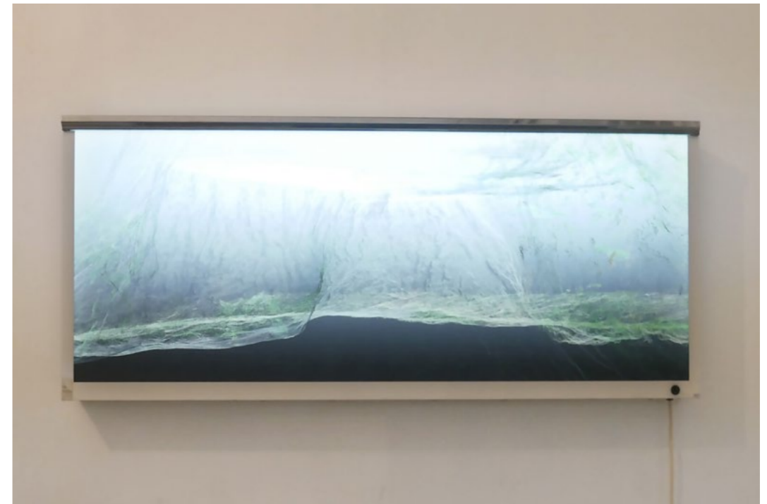
Daniel Bourgaïs, Bovan - Lune n°7_a, 2022 Photogrammétries, Impression UV sur Diffusant double encrage 3 mm Négatoscope 120 x 49 cm

Ces éclipses nous rappelant la fragilité du paysage, sa transformation.