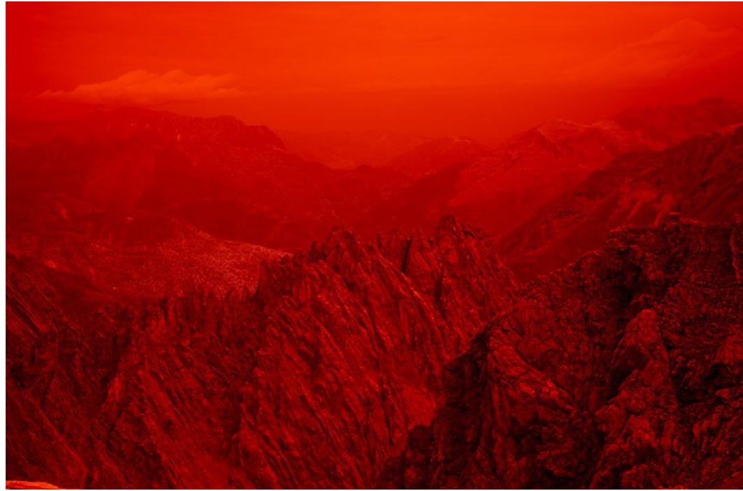
Florence Cardenti, On the crest line, 2023 Tirage Cibachrome encadré sous verre 70 x 94 cm