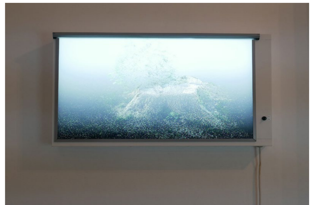
Daniel Bourgaïs, Bovan - Lune n°7_d Photogrammétries, Impression UV sur Diffusant double encrage 3 mm Négatoscope 98x49 cm - 2022