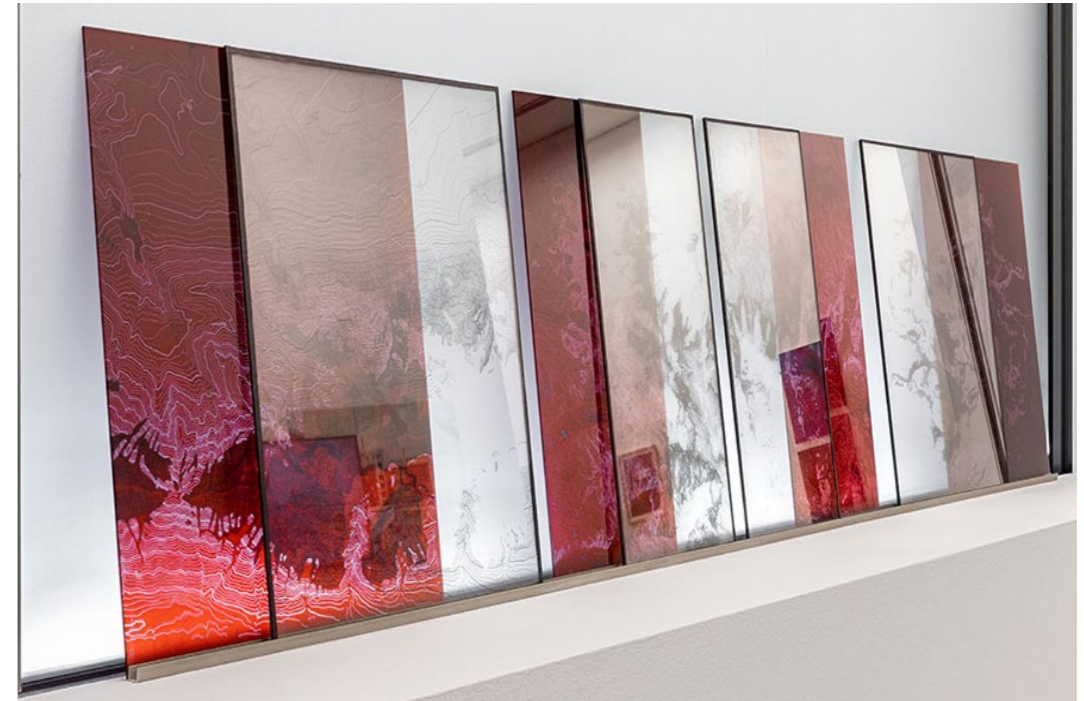
Florence Cardenti, On the crest line, 2022 4 doubles plaques composé d'un négatif rouge sur plexi et d'un tirage en Gélatino-bromure d'argent sur verre. 2 formats larges, 40 x 50 cm et 2 formats longs, 24.5 x 50 cm

Une autre retranscription des fonds est réalisée par l'artiste avec On the crest line , en réinterprétant des typons d'anciens fonds de cartes. L'installation se compose de 4 jeux de plaques de négatif rouges, de leurs positifs au gélatino-bromure sur verre et d'une photographie prise avec un filtre infrarouge. Pour cette série, elle utilise la technique du cibachrome, procédé spécifique de tirage couleur par destruction de pigment, technique en disparition.