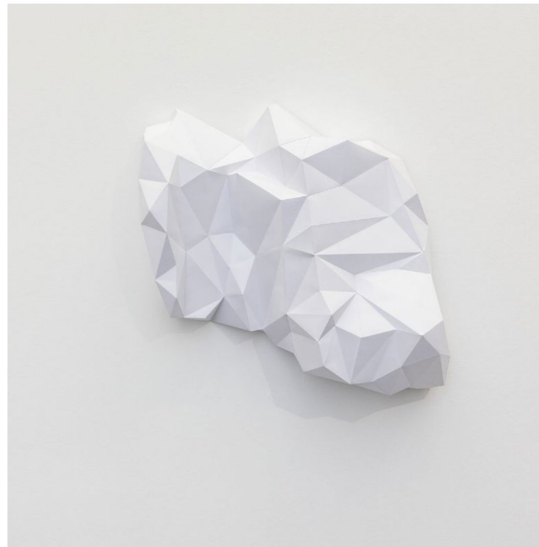
Florence Cardenti, Stone Survey, 2023 Sculpture papier du modèle synthétisé de la pierre. 85 x 60 x 21 cm

L'installation Stone Survey est une variation autour d'une simple pierre rapportée de sommets montagneux. La pierre, sa modélisation 3D, avatar manipulable sur écran tactile et sa sculpture en papier très agrandie, forment un ensemble de déclinaisons visuelles reliant le microcosme au macrocosme, le réel au virtuel.