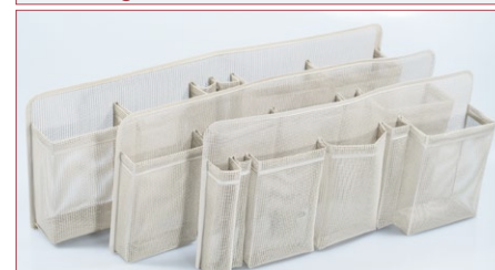
Seitenfacheinsatz Klein-, Groß-, Langformat