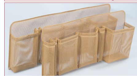
Seitenfacheinsatz Klein-, Großformat