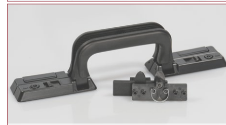
Scharnier-Set, Schloß-/Griffsystem Rusticana