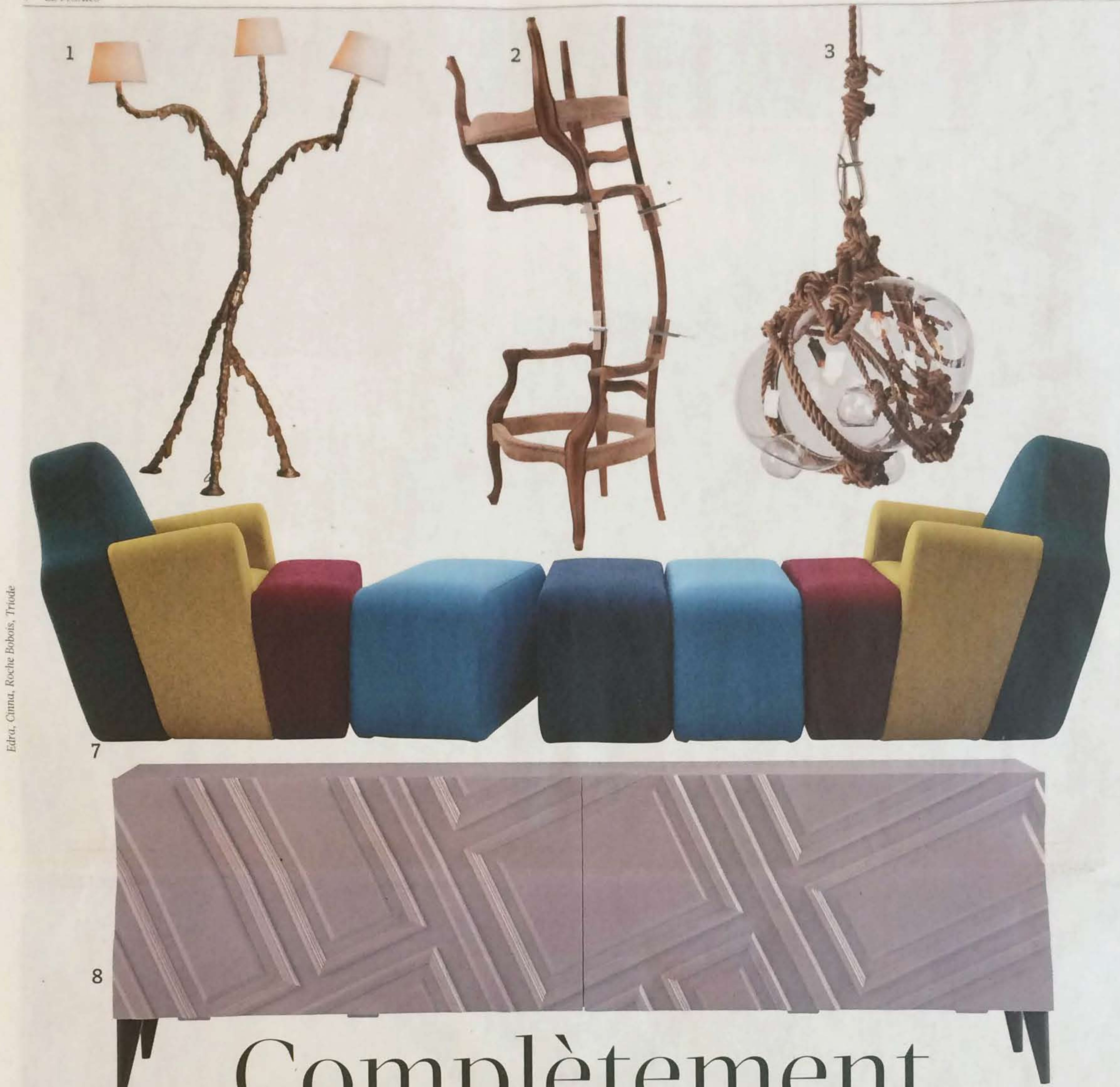
Édrea, Cinna, Roche Bobois, Triode