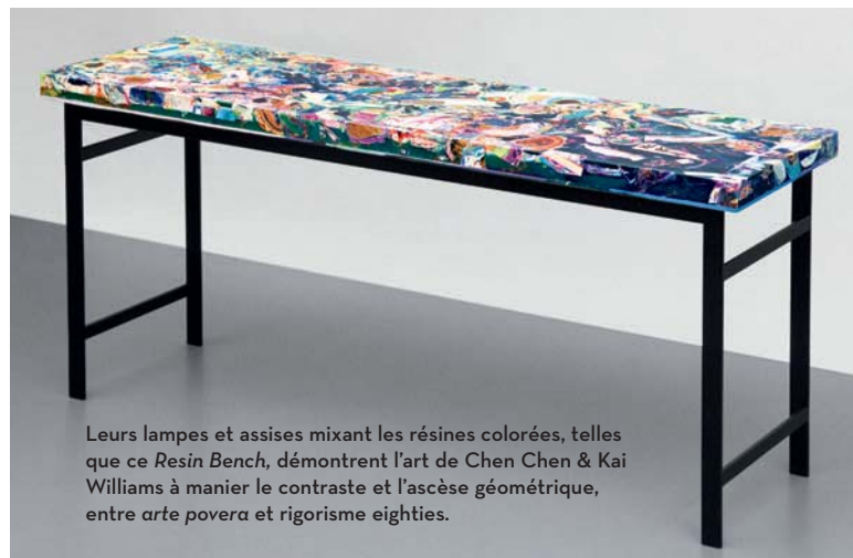
Leurs lampes et assises mixant les résines colorées, telles que ce Resin Bench , démontrent l'art de Chen Chen & Kai Williams à manier le contraste et l'ascèse géométrique, entre arte povera et rigorisme eighties.