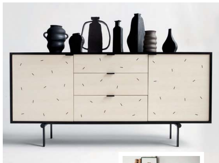
Syrette Lew signe le buffet Confetti en érable à l'empreinte graphique minimale.

Clairement, celle de Brooklyn arrive à maturité. Quand je m'y suis installée en 2006, les créations avaient des gimmicks d'esthétique post-industrielle. Avec les échanges via les médias sociaux, elle est désormais plus hétérogène.