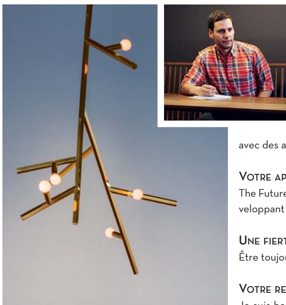
Le lustre Linden de Charles de Lisle, pile dans la tendance des luminaires aux allures de branchages, est vendu chez The Future Perfect.