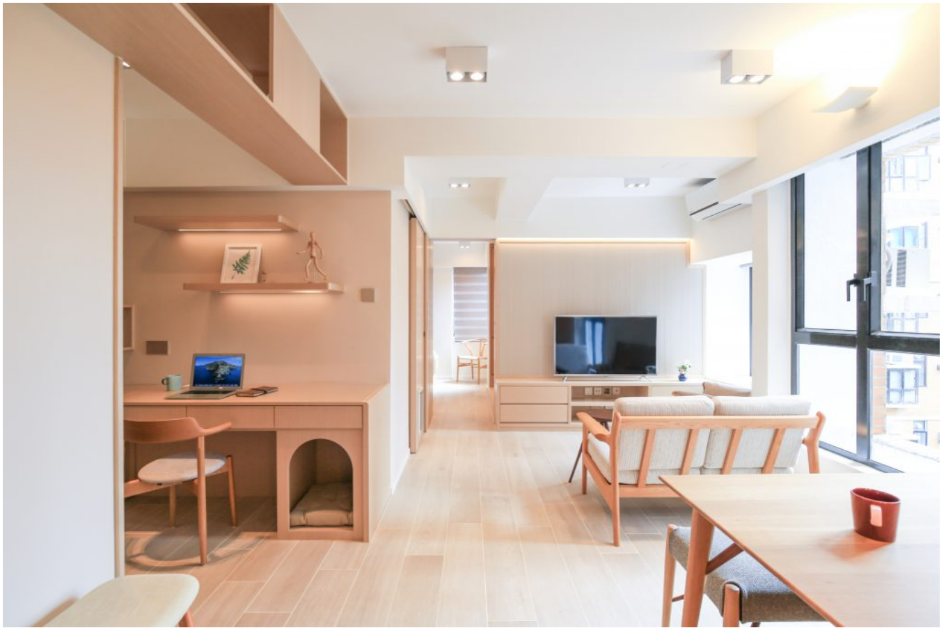
單位其中一間細房則與客廳打通，休息空間更寬敞。