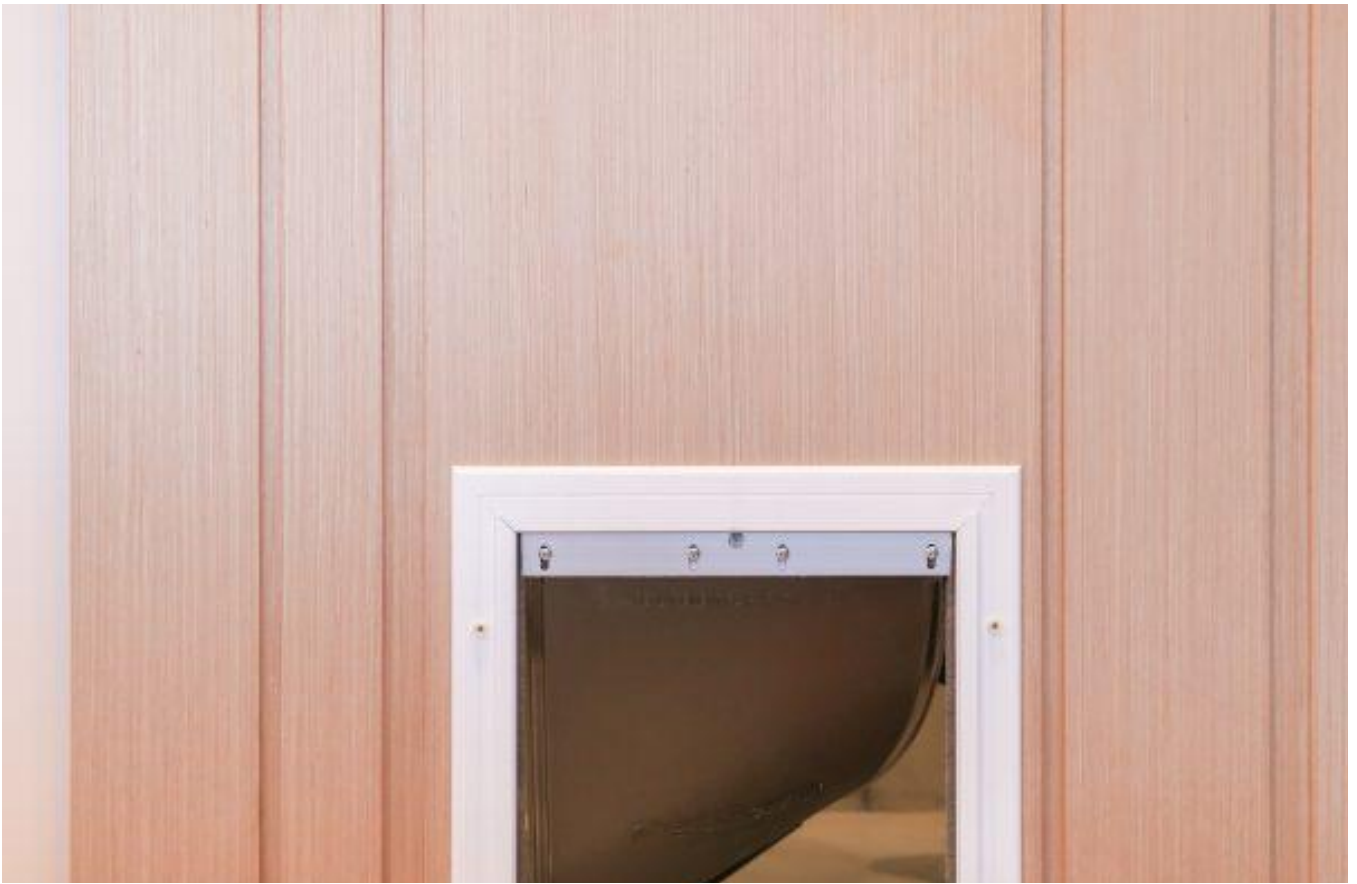
浴室門上特設貓咪專用活門