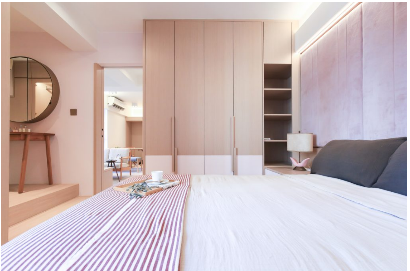
單位末端的兩個房間打通為一間大房連衣帽間。