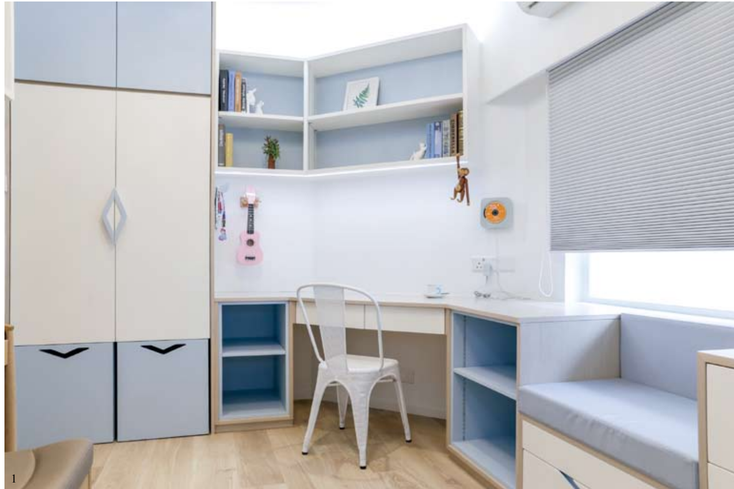
1/ 為增添童話元素，女兒房採用了兩款窗簾、三款童話牆紙，創造更像真傳神的童話國度。 2/ 衣櫃下的玩具櫃可同時充當椅子，方便戶主陪伴女兒學習和遊戲。