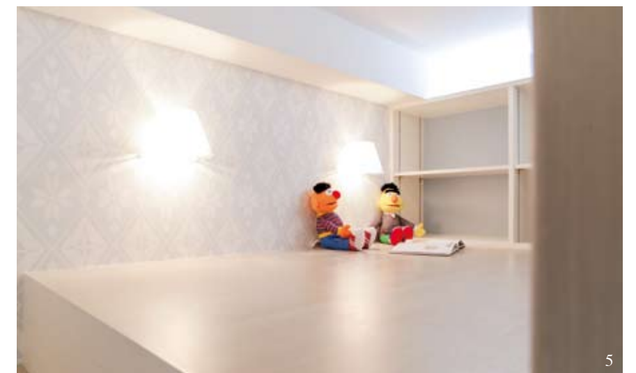
3/ 房間中心安裝了一盞精緻的水晶燈，感覺宛如置身公主的宴會廳。 4/ 雪花床欄背後隱藏著一個小閣樓，從窗旁的儲物櫃頂拾級而上，便可發現一個藏書閣。 5/ 在這個小小的特色空間，鋪設了藍白色印花牆紙並配上壁燈，令感覺更添夢幻色彩。

雪花床欄背後隱藏著一個小閣樓，從窗旁的儲物櫃頂拾級而上，便可來到一個藏書閣，女孩可在此處享受閱讀樂趣，亦可邀請朋友來玩桌上遊戲。在這個小小的特色空間，鋪設了藍白色印花牆紙並配上壁燈，令感覺更添夢幻色彩。●