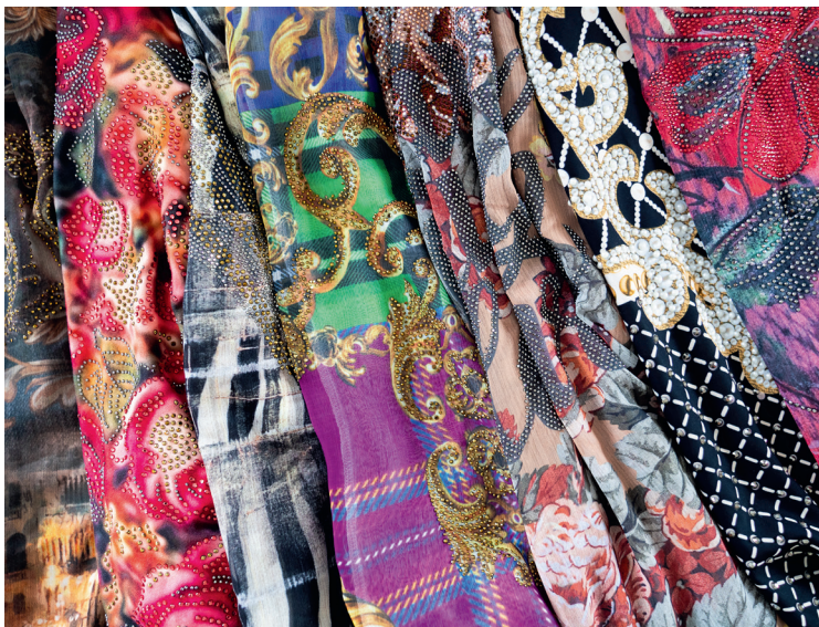
Einige der exklusiven Motive werden handgemalt und anschließend als Druck dupliziert