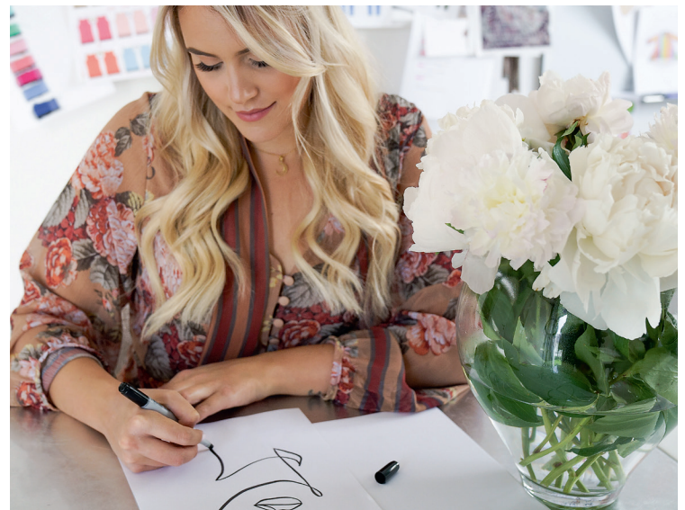
Die Designs sind selbst kreiert und inspiriert von Städten und Emotionen