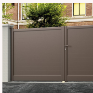
Rectangulaire (lames 120 ou 200 mm)