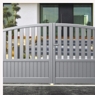
Cintré (lames 100 mm)