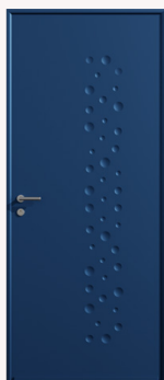
Volontaire Porte pleine Poignée à rosace | Barillet 3 clés Pattes équerres | Décors emboutissages sphériques sur les deux faces