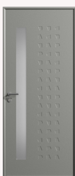
Épanouie Vitrage Satinovo 4SA-276G-44.2ITR de 1670 x 145 m Poignée à rosace | Barillet 3 clés Pattes équerres | Décors emboutissages trapézoïdaux sur les deux faces