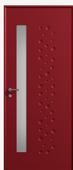
Affectueuse Vitrage Satinovo 4SA-276G-44.2ITR de 1670 x 145 m Poignée à rosace | Barillet 3 clés Pattes équerres | Décors emboutissages sphériques sur les deux faces