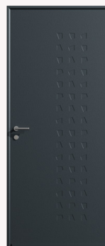
Appliquée Porte pleine Poignée à rosace | Barillet 3 clés Pattes équerres | Décors emboutissages trapézoïdaux sur les deux faces