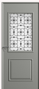
Élégante Vitrage Satinovo 4SA-16G-44.2ITR de 911 x 555 m Décor sérigraphié | Poignée à rosace en fer brossé | Pattes équerres